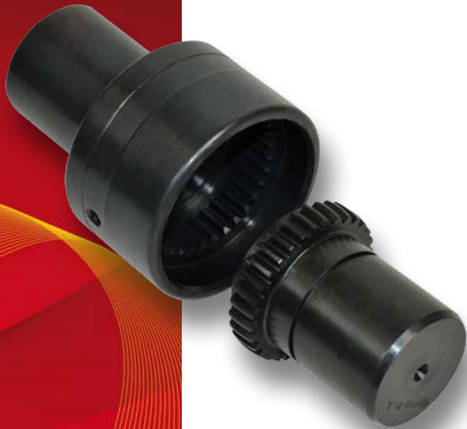
GIUNTO GFAS CAMPANA IN ACCIAIO